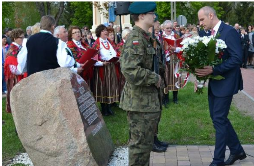
SADOWIANKI śpiewają „Witaj Majowa Jutrzenko”

strzelców z Jednostki Strzeleckiej im. Dywizjonu Huzarów Śmierci oraz harcerzy z Drużyny Harcerskiej działającej w Szkole Podstawowej w Sadownem.