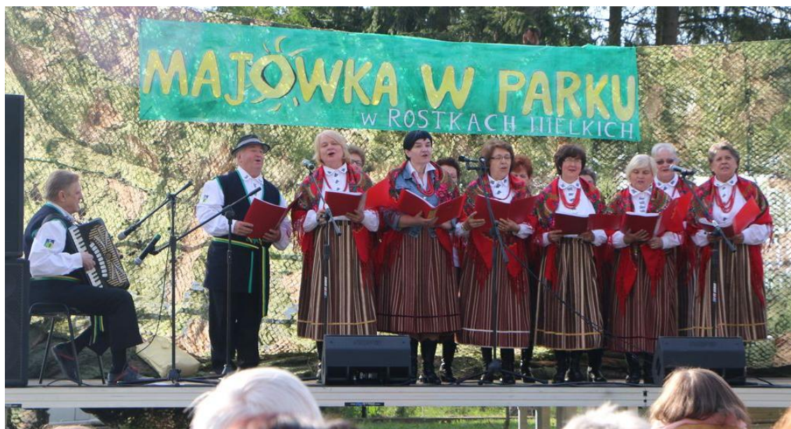
Zespół Śpiewaczy SADOWIANKI