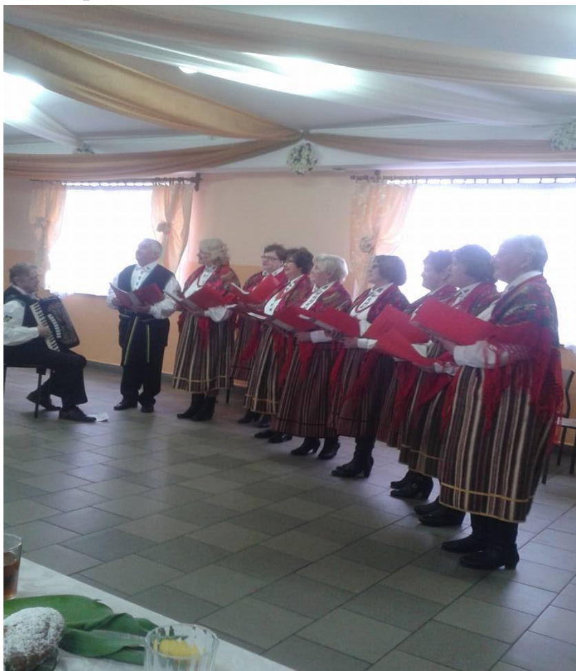
SADOWIANKI w Grygrowie