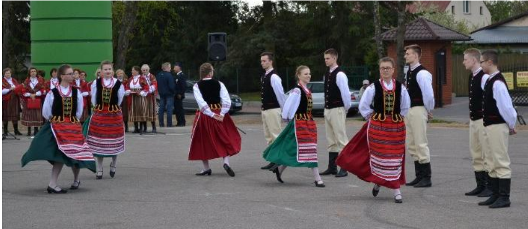
Grupa Taneczna z Zespołu Szkół Ponadgimnazjalnych w Sadownem SADOWNE