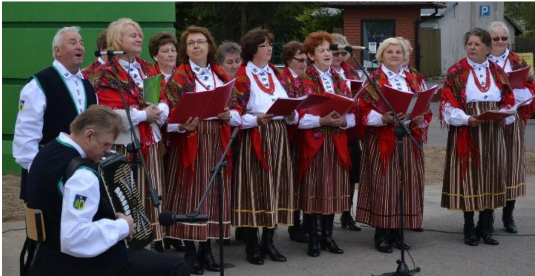
Zespół Śpiewaczy SADOWIANKI